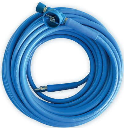
Manguera de 15 metros incluida.